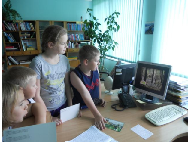
Neklātienes ceļojumu (CD noskatīšanās) „Meža zeme Latvija”