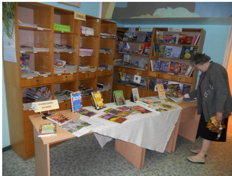
Grāmatu izstāde „Gatavojoties pavasara dārza darbiem”

Lielākais un gaidītākais pasākums bērniem bija 2013. noslēguma aktivitāte „Lasīšanas Līderis”. Bibliotēkas draugi un grāmatu mīļotāji lasīja dzejoļus, minēja mīklas, piedalījās spēlē – „Teatrāla improvizācija”.